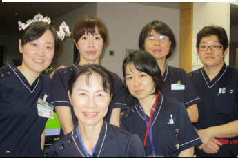
佐賀市立富士大和温泉病院 63-0111 ホームページ http://www.hospitalfj.saga.jp/